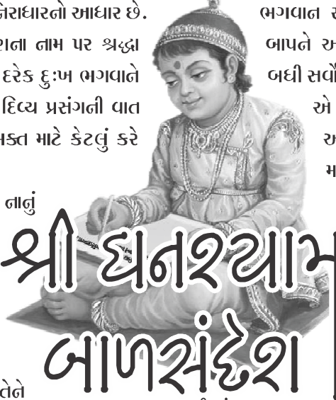
શા. સ્વામી સંતસ્વરૂપદાસજી

શ્રીસ્વામિનારાયણ ભગવાનમાં અપાર પ્રીતિ રાખનાર જેઠિયો એક દિવસ માંદો પડ્યો. અને એવો માંદો પડ્યો કે કોઈ વાતે તેને સારું જ ન થાય અને તે બોલી જ ન શકે. ઘણી દવા કરી પણ કઇ અસર જ ન કરે. ગામ લોકોએ જેઠિયાના મા-બાપને કહ્યું, 'કોઈએ તમારા દીકરા પર કાળો જાદુ કર્યો છે. નક્કી તેને ભૂત વળગ્યું છે. આમ બેઠા રહેવાથી કંઈ નહીં થાય. જલદી જાવ અને ભૂવાને બોલાવી લાવો.' જેઠીયો પાકો સત્સંગી હતો અને તેના મા-બાપ પણ સ્વામિનારાયણનું નામ લઈને જ આગળ વધવાવાળા હતાં. તેથી આવી વાત સાંભળીને જેઠિયાના બાપે કહ્યું, 'અહીં એવી વાત કોઈપણ કરશો નહીં. મારો દીકરો જીવે કે મરે પણ મારાથી ભૂવા પાસે તો જવાશે જ નહીં. સર્વ કર્તાહર્તા ભગવાન છે. ભગવાનની ઈચ્છા હશે તેમ થશે. મંત્ર-જંત્રથી કે ભૂવા પાસે જોવડાવવાથી કાંઈ પણ સિદ્ધિ પ્રાપ્ત થાય નહીં, અને મંદવાડ પણ દૂર થાય નહીં. શરીર સાંજું-માંદું થાય તો ઔષધ જરૂર કરવું, પણ શ્રદ્ધા તો એક સ્વામિનારાયણ ભગવાન ઉપર જ રાખવી.'