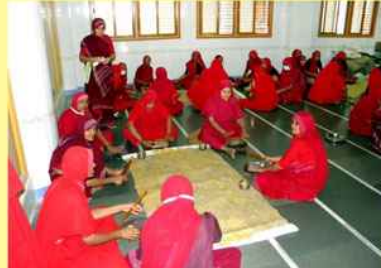
અન્નકૂટની સેવામાં સાં. યો. બહેનો તથા કર્મયોગી બહેનો