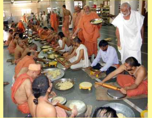
અન્નકૂટની પૂર્વતૈયારીના ભાગરૂપે સેવા કરતા સંતો સાથે પૂ. મહંત સ્વામી