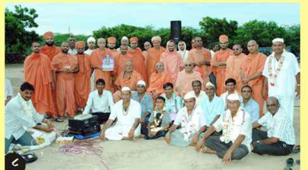
(૧) નવા વર્ષના શુભભાતે સંતોની વિશાળ સભાનાં દર્શન-ભુજ. (૨) શરદપૂર્ણિમાના દિવસે રાસોત્સવબાદ મહાઆરતીનો લાભ લેતા ભક્તો-અંજાર. (૩) શરદપૂર્ણિમાના દિવસે ઠાકોરજી આગળ દીપમાળાની આરતીના દર્શન-ભુજ. (૪) શરદપૂર્ણિમાના દિવસે રાસોત્સવ બાદ આરતી-માંડવી. (૫) દિવાળીના દિવસે ચોપડા પૂજનમાં ઉપસ્થિત શહેરનો વેપારી વર્ગ તથા પ.પૂ. સંતો-ભુજ. (૬) માંડવી થી નારાયણસરોવર, તેરા, કાળાતળાવના સત્સંગ પ્રવાસે કચ્છ શ્રી નરનારાયણદેવ યુવક મંડળના યુવાનો સાથે સંતો. (૭) કચ્છ શ્રી નરનારાયણદેવ યુવક મંડળ નાંગલપુર-માંડવી આયોજીત રાત્રીય સત્સંગ સભામાં ઉપસ્થિત અલગ અલગ વિસ્તારના વડીલો તથા યુવાનો. (૮) મીઠી વીરડી-માંડવી રાસોત્સવ બાદ યજમાન સાથે સંતો.