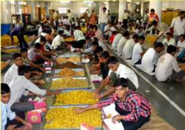
અન્નકૂટના થાળની પ્રસાદી ભરતા યુવા ભક્તો