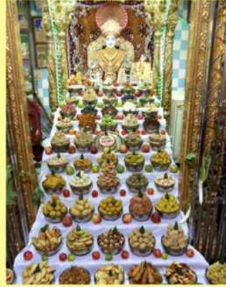
અંજાર મંદિરમાં શ્રી ઘનશ્યામ મહારાજ આગળ અન્નકૂટ દર્શન