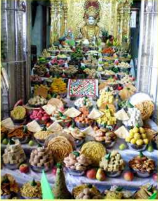
માંડવી મંદિરમાં ઠાકોરજી આગળ ધરાવાયેલ અન્નકૂટ