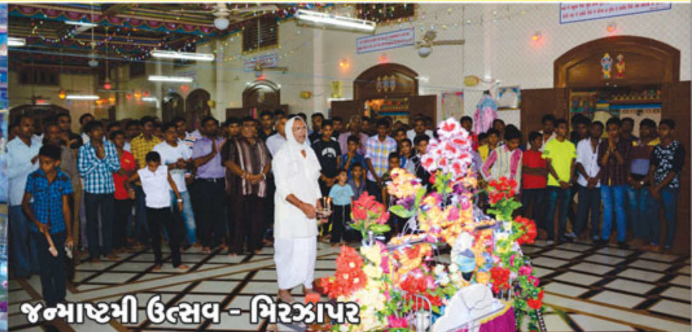
જન્માષ્ટમી ઉત્સવ - મિરઝાપર