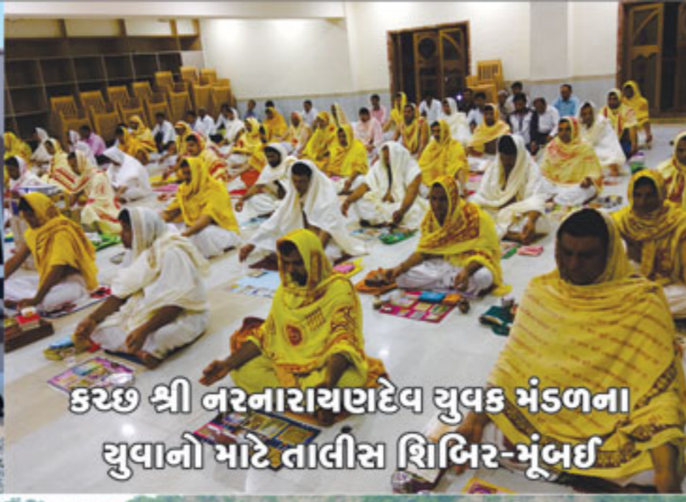
કચ્છ શ્રી નરનારાયણદેવ યુવક મંડળના યુવાનો માટે તાલીમ શિબિર-મુંબઈ