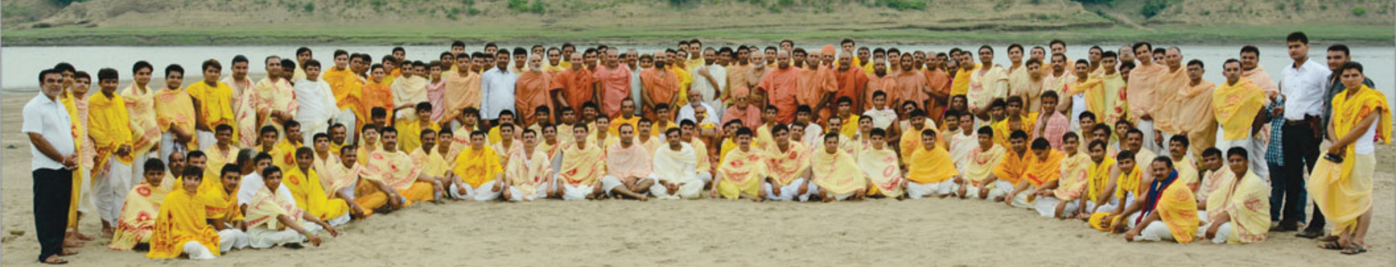
કચ્છશ્રી નરનારાયણદેવ યુવક મંડળના યુવાનોની સત્સંગ શિબિર - બરકાલ-નળિયાદ પ્રાંત