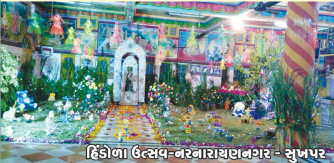
હિંડોળા ઉત્સવ-નરનારાયણનગર - સુખપર