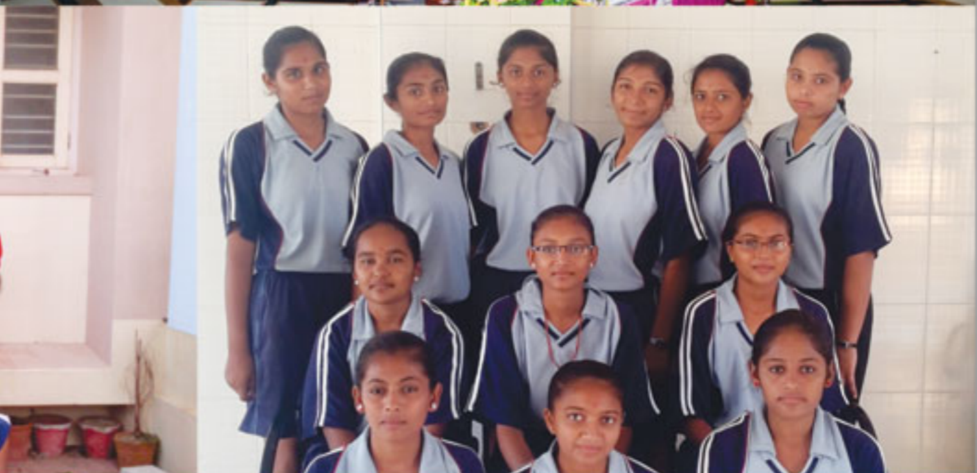
(૧) હિંડોળા ઉત્સવ-સત્સંગ ભવન (ઈન્દૌર), (૨-૩)શ્રી સ્વામિનારાયણ કન્યા વિદ્યામંદિરની વિદ્યાર્થીનીઓ જીદા કક્ષાએ ખો-ખો તેમજ વોલીબોલ સ્પર્ધામાં વિજેતા-ભુજ