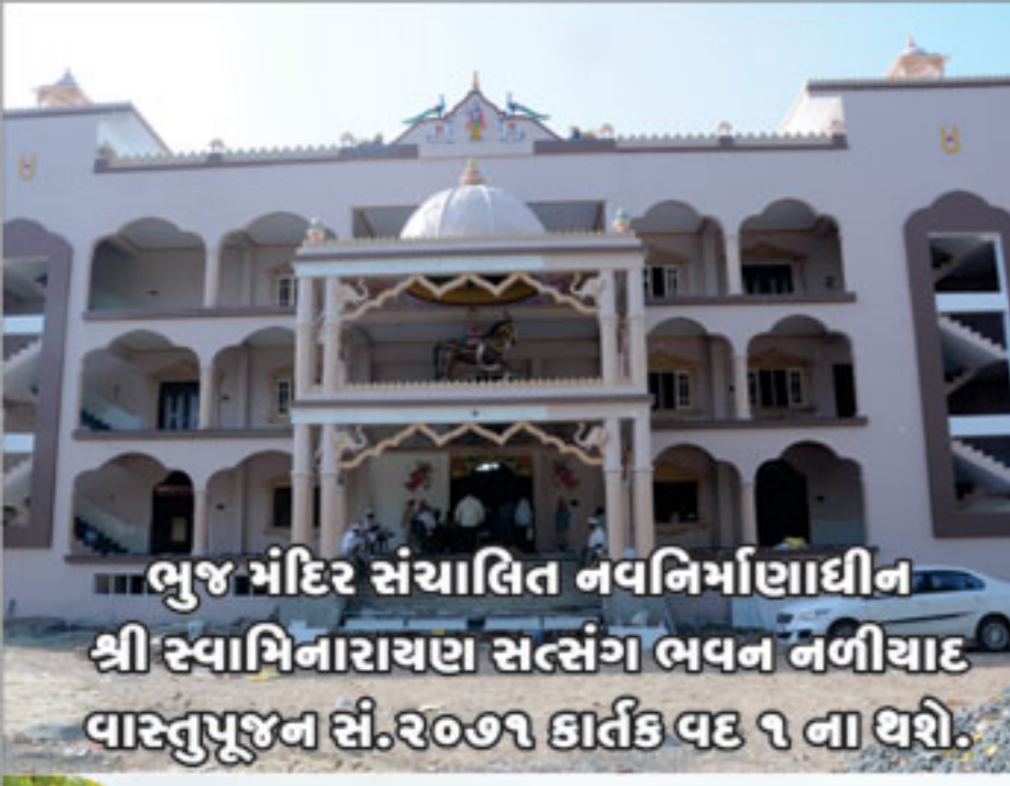
ભુજ મંદિર સંચાલિત નવનિર્માણાદીન શ્રી સ્વામિનારાયણ સત્સંગ ભવન નળીયાદ વાસ્તુપૂજન સં.૨૦૭૧ કાર્તિક વદ ૧ ના થશે.