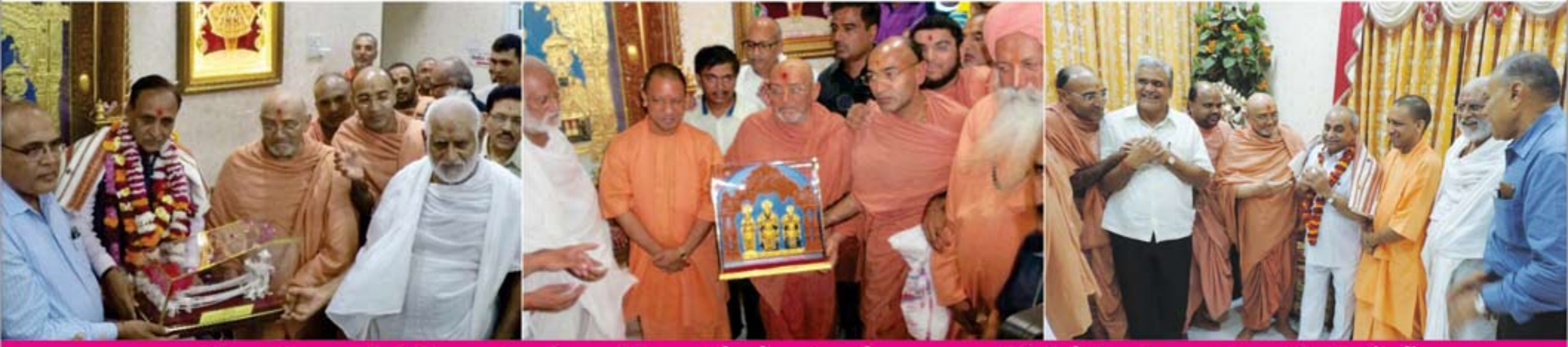
મા. ગુજરાતના મુખ્યમંત્રી તથા ઉપમુખ્યમંત્રી શ્રી વિજયભાઈ રૂપાણી તથા નીતિનભાઈ પટેલ તેમજ ઉત્તર પ્રદેશના મા. મુખ્ય મંત્રીશ્રી યોગી આદિત્યનાથનું ભુજ મંદિરમાં દર્શનાર્થે આગમન-ભુજ