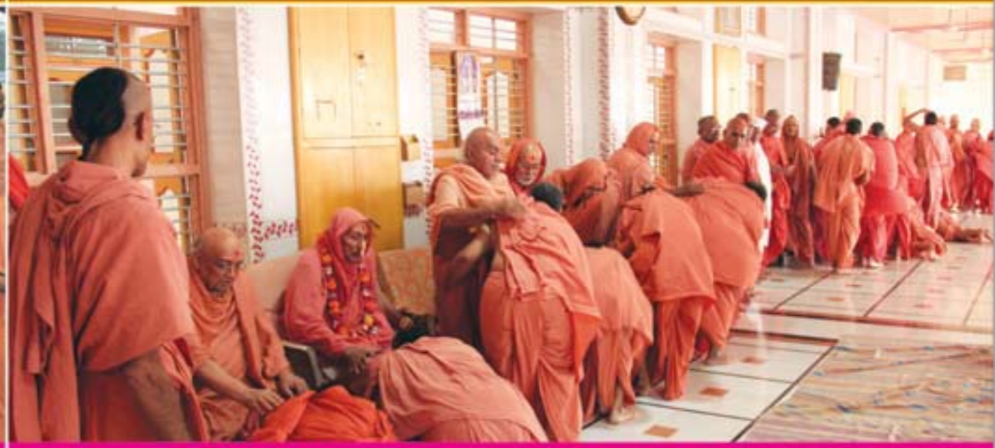
નૂતન વર્ષના દિવસે પરસ્પર સંતોનું મિલન-ભુજ