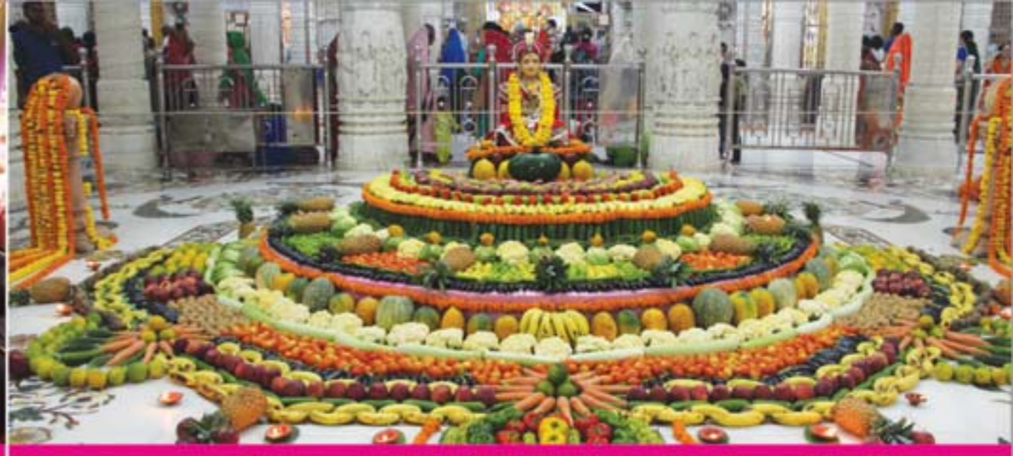
ભુજ મંદિરના રંગમંડપમાં ફળોની રંગોળી