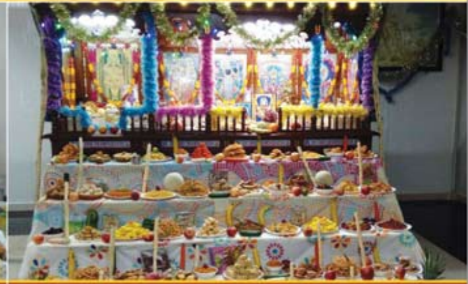
મસ્કત ગાલા કેમ્પ અલતૂર્કી- અણફૂટ દર્શન