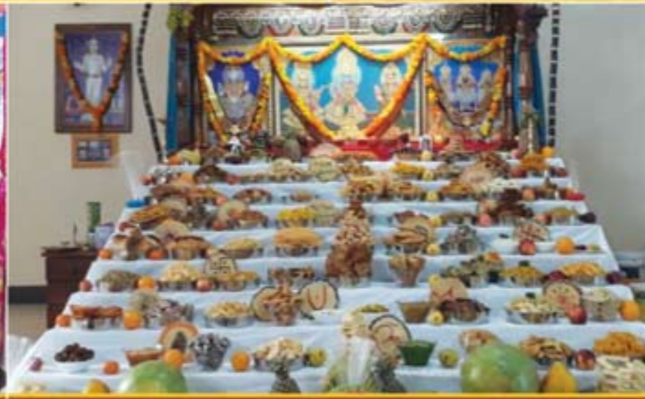
ગાંબીયા - સેનેગલ - અણફૂટ દર્શન