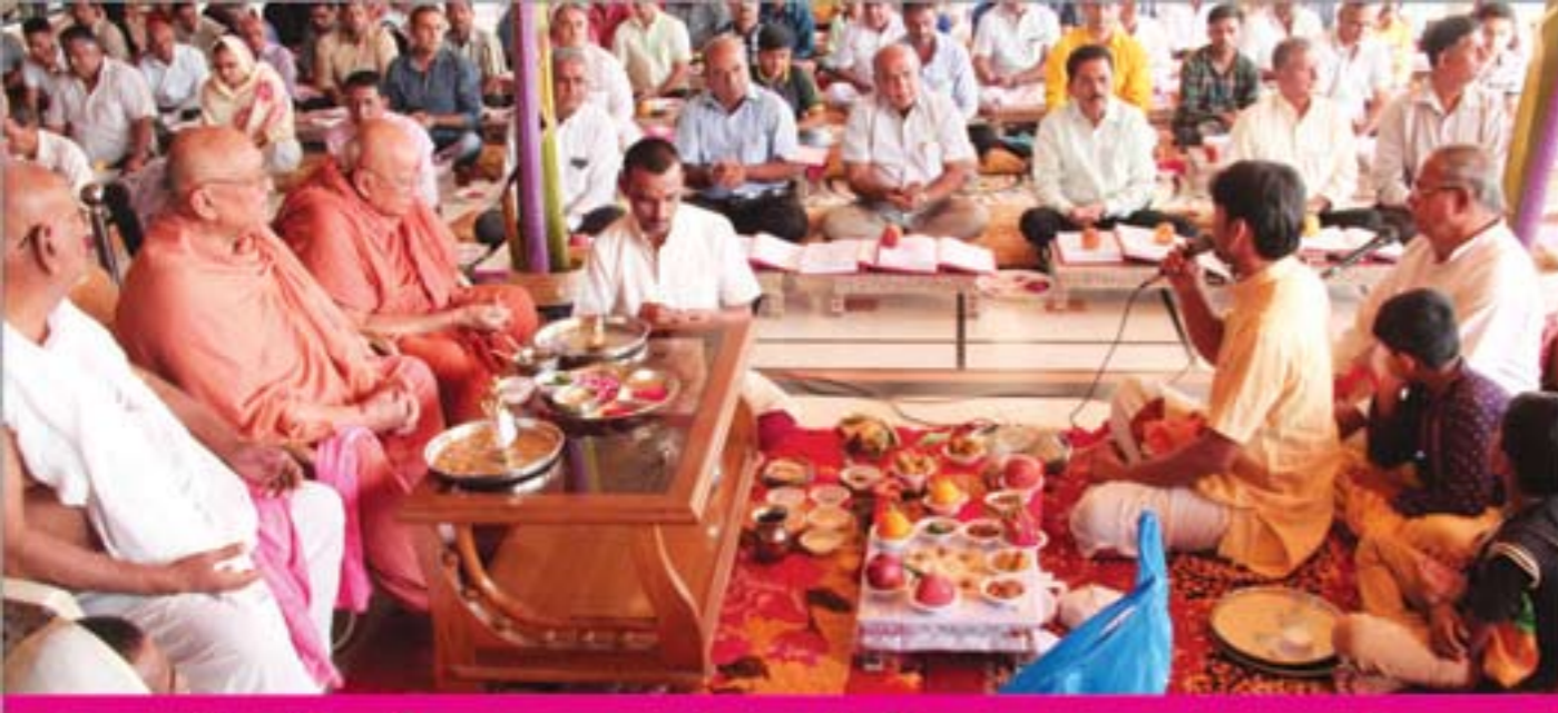
દિવાળીના દિવસે ભુજ સભા મંડપમાં ચોપડા પૂજન તથા લક્ષ્મીપૂજન