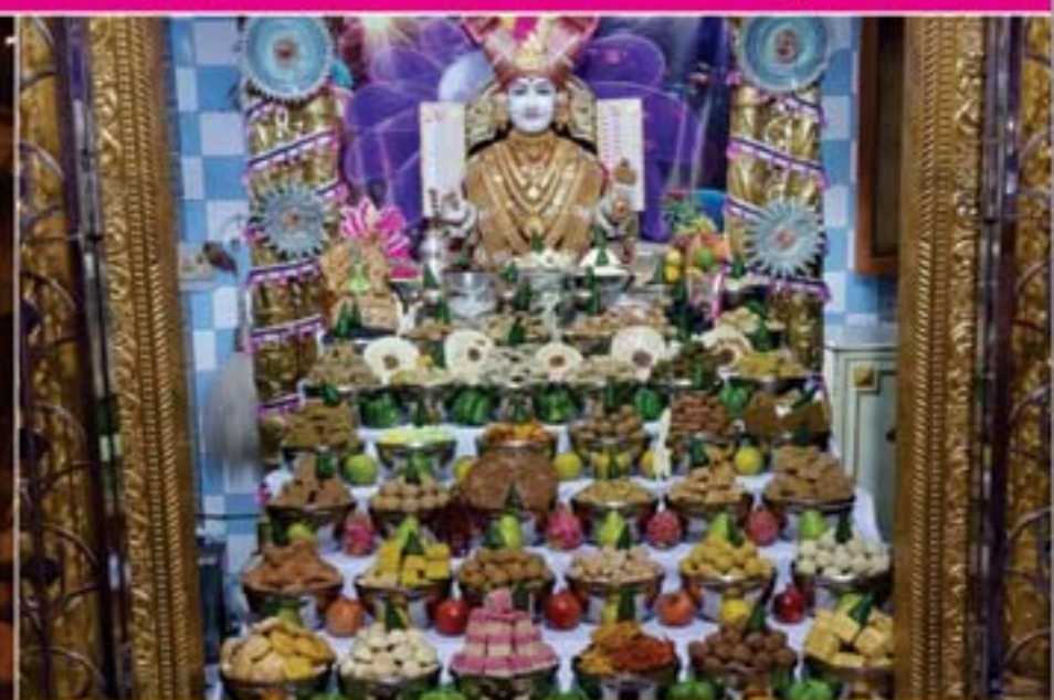
નૂતન વર્ષારંભે રંગોળી સાથે દીપોત્સવ તથા અણફૂટ દર્શન - અંજાર