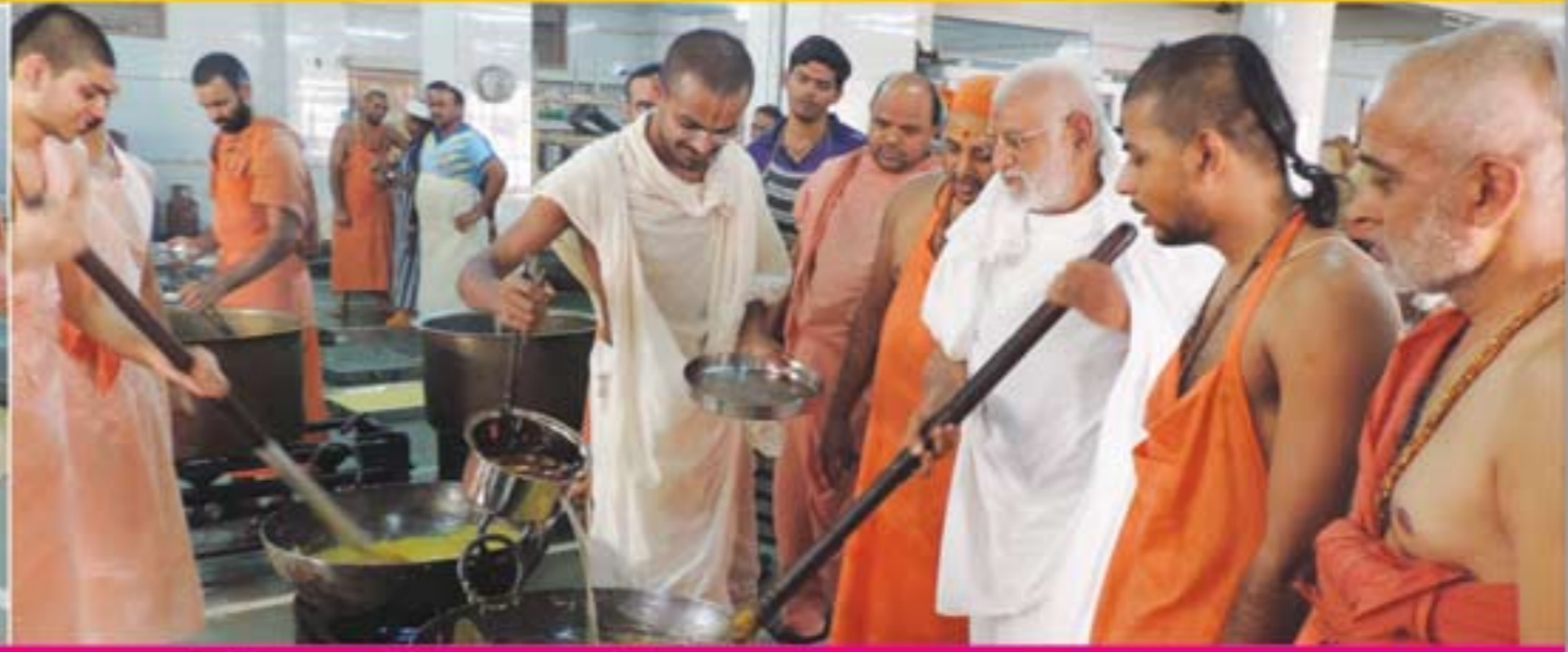
અગ્નિકૂટ માટે વિવિધ વાનગીઓ બનાવતા સંતો-પાર્ષદો તથા હરિભક્તો-ભુજ