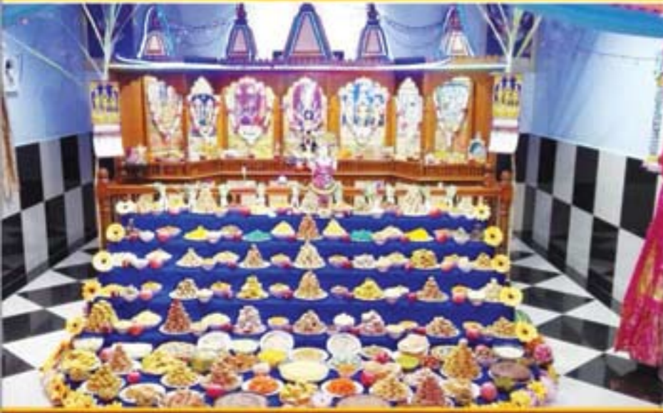
અલ્તુર્કી ઓમાન-અણફૂટ દર્શન