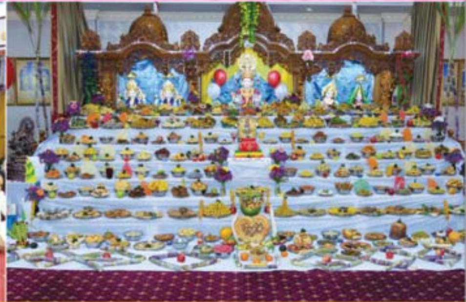
ઓસ્ટ્રેલીયા એડેલાઈડ-અણફૂટ દર્શન