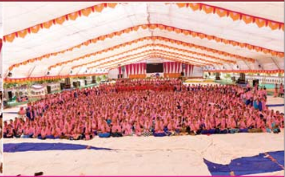
કચ્છશ્રી નરનારાયણદેવ યુવક યુવતી મંડળની ૧૪મી સત્સંગ શિબિર સંપન્ન-ભુજ