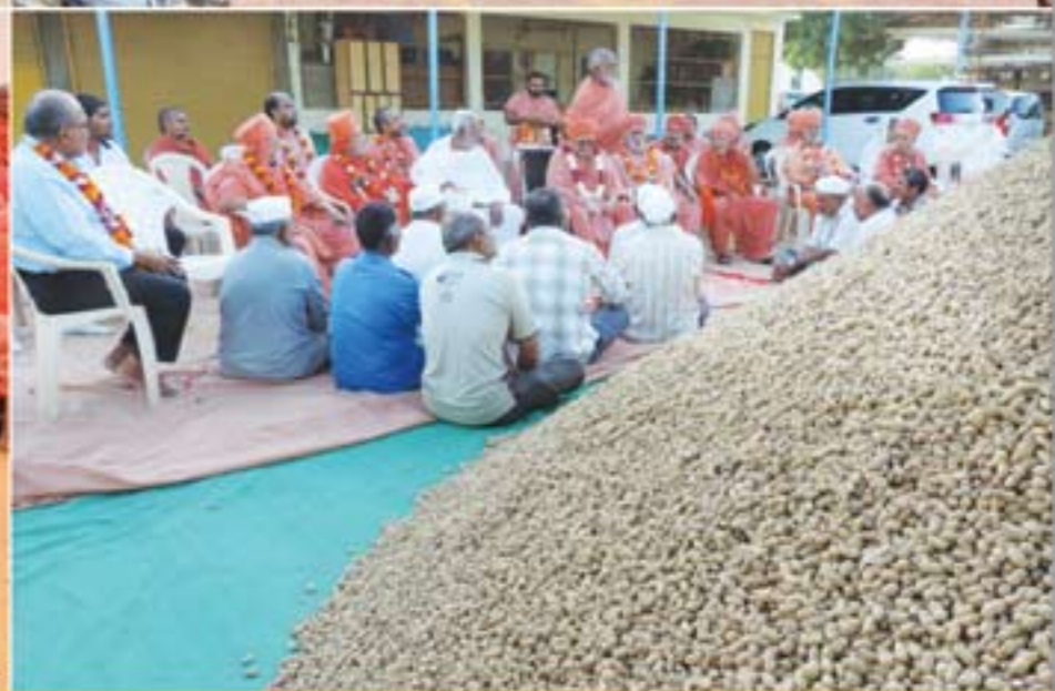
મુંદ્રા શેહરમાં તૈયાર થયેલ નૂતન મંદિરનું વાસ્તુપૂજન સંપન્ન-મુંદ્રા