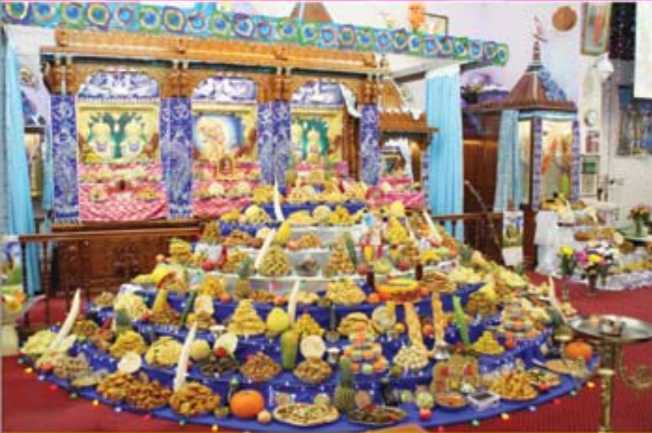
લંડન બોલ્ટન-અણફૂટ દર્શન