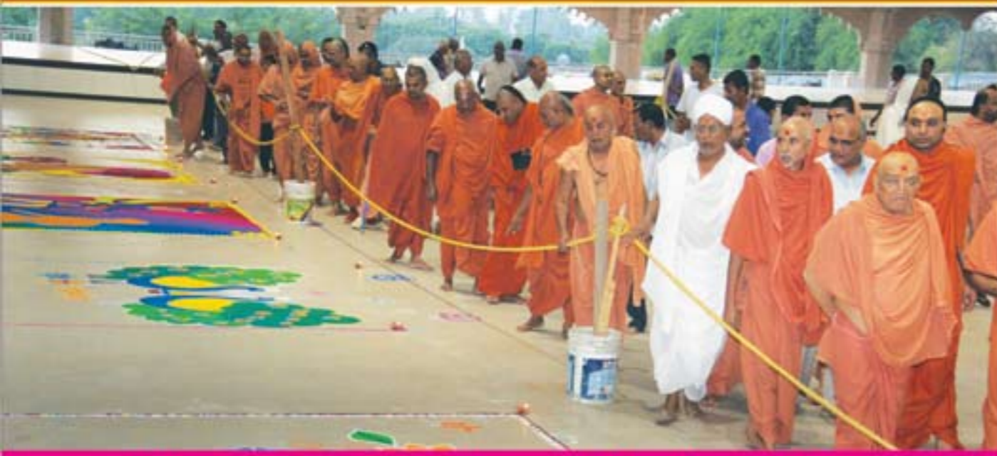
ભુજ મંદિરના મોટા સભામંડપમાં રંગોળી સ્પર્ધા ઉદ્ઘાટન