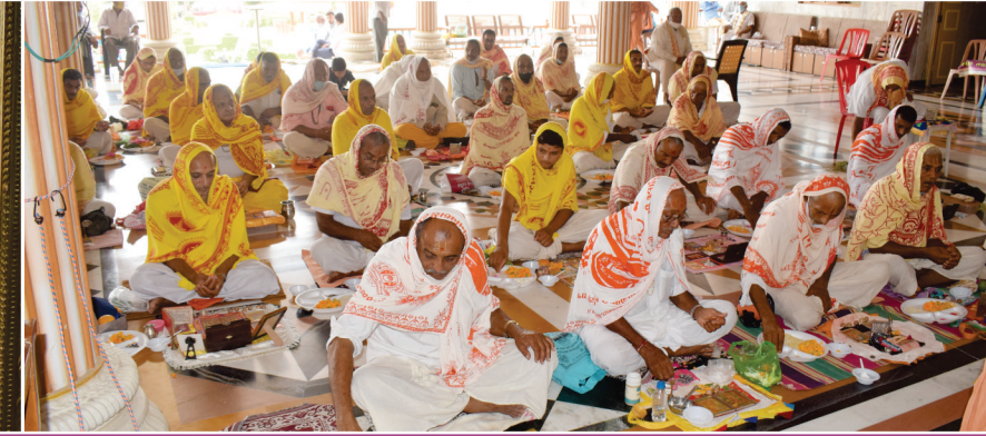
ગુરુપૂર્ણિમા દિને મહાપૂજા, શ્રીઠાકોરજી તથા સંતોનું પૂજન તથા નાળિયેર ઉત્સવ - માંડવી