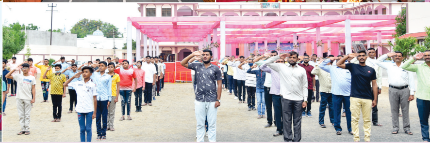
સંસ્કારધામ જીર્ણોદ્ધાર પ્રસંગે હરિયાગ તથા ત્રિરાત્રીય સત્સંગ સભા - માંડવી