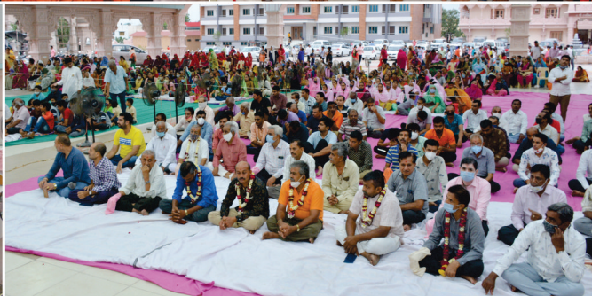
हिंदोला उद्घाटन तथा काबु उत्सव- अंजार